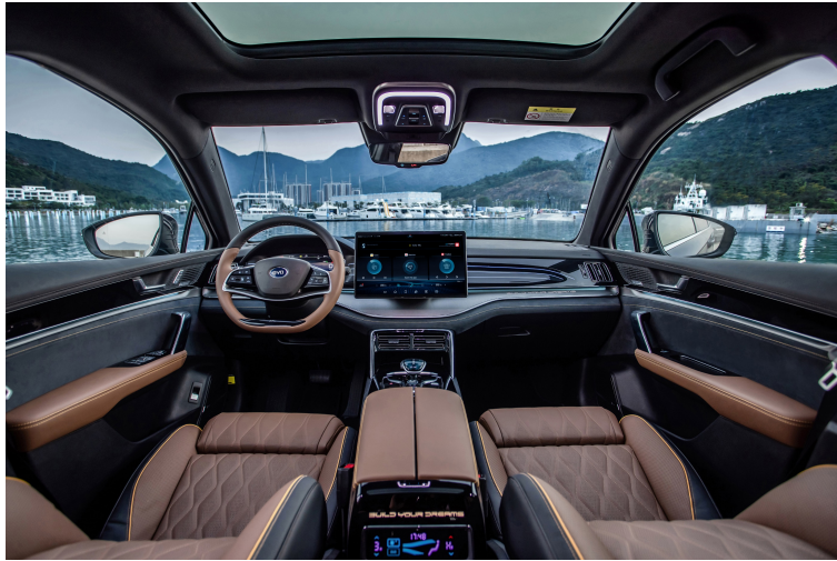
Pantalla giratoria 14.6"