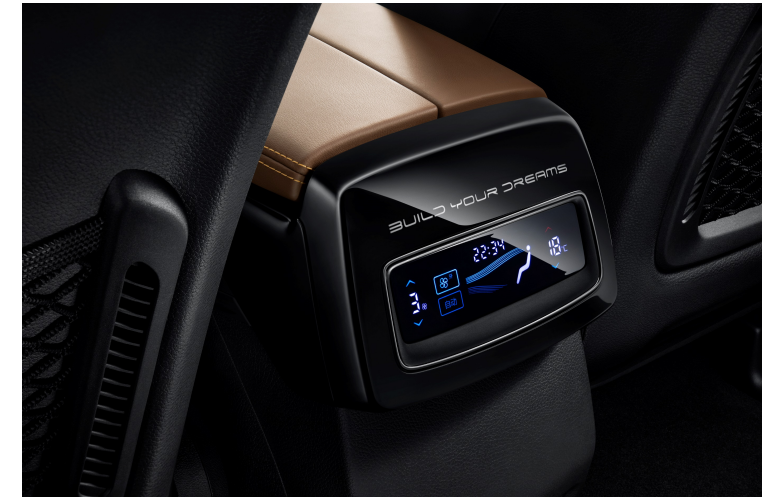
Aire acondicionado climatronic