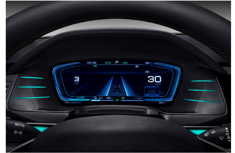
Sistema de advertencia de salida de carril