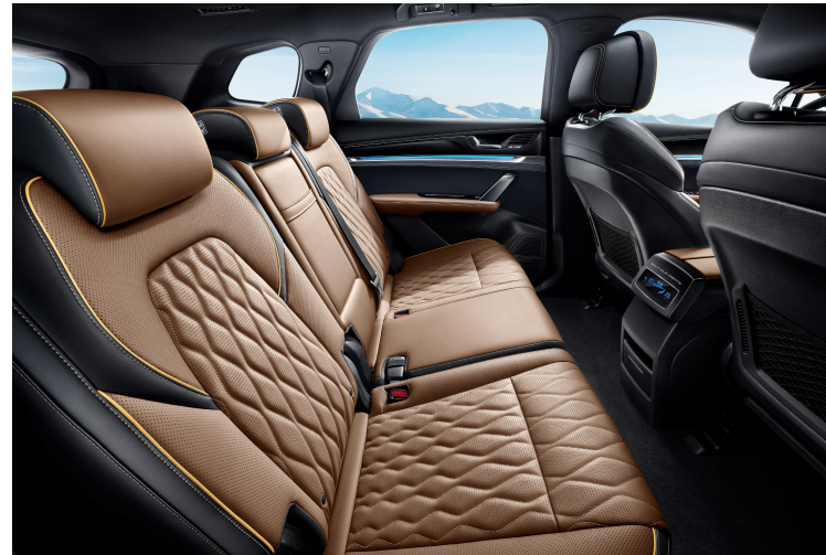
Asientos en Cuero Napa de alta calidad